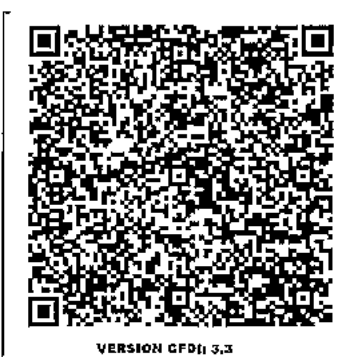
VERSION CFDI: 3.3

REGIMEN FISCAL: 601 - General de Ley Personas Morales LUGAR DE EXPEDICION: 44110 FORMA DE PAGO: 28 - Tarjeta de débito METODO DE PAGO: PUE - Pago en una sola exhibición MONEDA: MXN - Peso Mexicano USO DE CFDI: 003 - Gastos en general